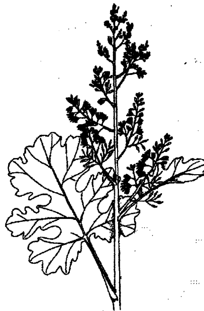
Vippvallmo ( Macleaya cordata )

På samma jordvall upptäcktes för bara något år sedan en annan rar växt. Det var ulltistel , men eftersom denna växt inte är perenn, har inga ytterligare plantor av denna ört upptäckts